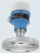
Cerabar M PMP55