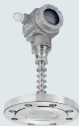
Cerabar S PMP75