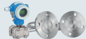
Deltabar S FMD78